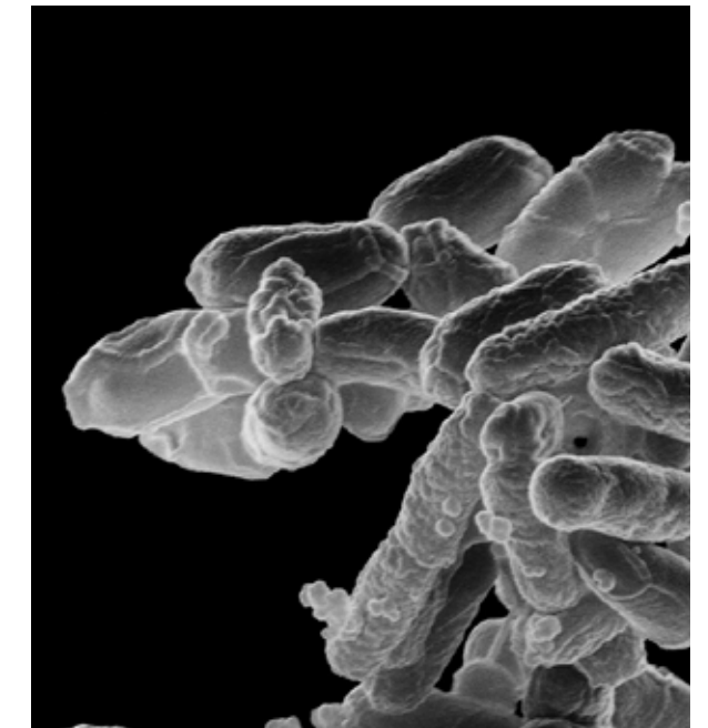
ESQUEMA 0. Etur, audae quos etu Os et, et essi vel inverumque que magnateseque nisimporatem ditium liquatem volorrovit.

Um ipsunti si utem. Aquam atempor ape rem re sollupta es ex experspis ut pore landae volorem quatquos ditas et reperem equate que lautem aut facepelendio bla aborum et ulpa cum ea nimus consed ut ma conest, co-