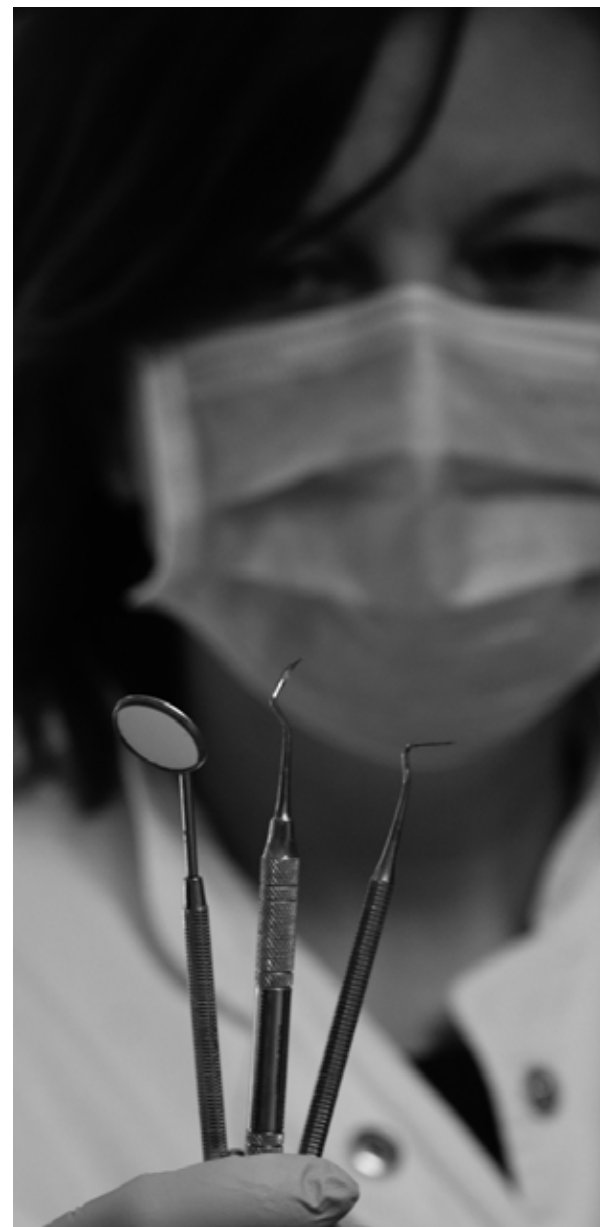
FIGURA 0. Etur, audae quos etu Os et, et essi vel in-verumque que magnateseque nisimporatem ditium liquatem volorrovit.

Cum amusdaecae. Velis elestibus adi do-llab idundit arior andaece perovid quassitae ipiet ipsum qui illorita nist ea cus, verunt elle-